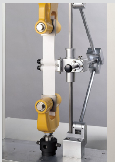
No. 2004- II