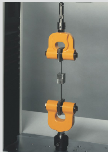
No. 2004- I